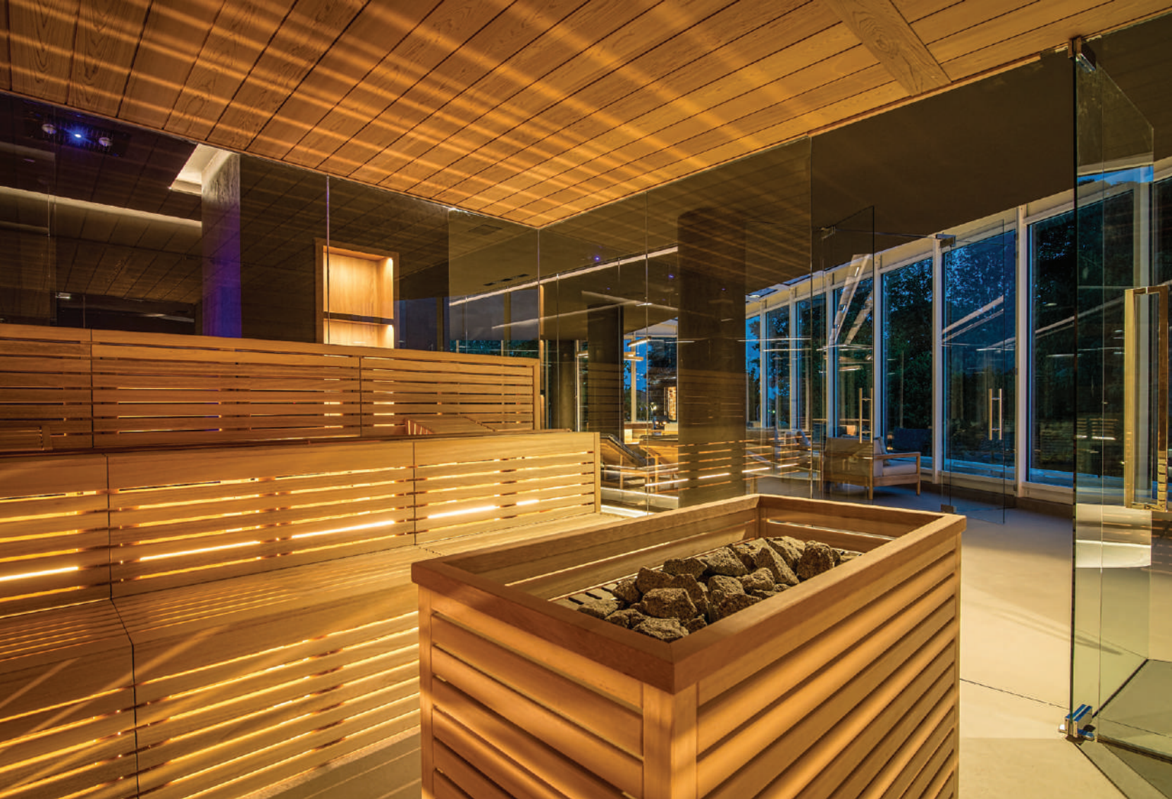
this page_top, 핀란드식 사우나는 유약을 칠하고 삼나무로 만든 벤치를 설치해 은은한 향기가 풍긴다. this page_bottom, 과테말라 녹색 대리석으로 만들어진 터키식 목욕탕은 대형 유리를 전면 벽으로 적용해 고급스러움을 자아낸다.