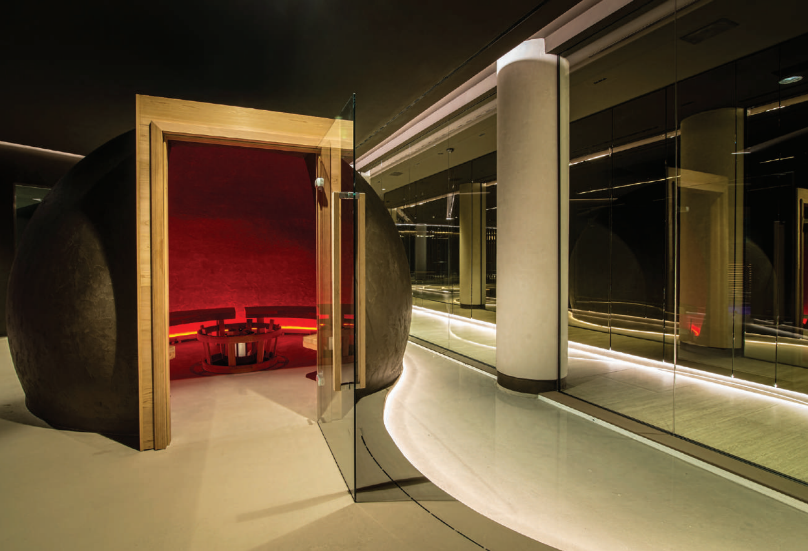
this page. 돔 모양의 테마즈칼(Temazcal, 증기 사우나) 공간이 멋스럽게 연출되어 있다.

이번 프로젝트는 주변 자연과의 직접적인 연결을 통해 깊은 휴식과 조화를 경험하게 했다. Studio Apostoli가 디자인한 새로운 경험의 Neró Spa는 이탈리아 몬테그로토 테르메의 유명한 Hotel Terme Preistoriche에서 수백 년 된 내부 공원이 내려다보이는 건물 최상층에 만들어졌다. 1,200 sqm의 새로운 환경은 총 500㎡가 넘는 수로에서 56개의 월풀과 6개의 경주 폭포를 갖춘 2개의 야외 온천 수영장, 2개의 실내 수영장으로 구성되었다. 아방가르드한 Neró Spa는 예술 작품으로 고안된 다기능적이고 전체론적인 본질을 추구하고 있다. 더욱이 수천 년 동안 물의 치료적 특성 및 가치를 인정해 온 지역의 역사와 영토의 성격을 표현했다. 그만큼 이번 프로젝트는 스파, 영토 및 예술의 조화로운 결합이라고 볼 수 있다. 건축적 관점에서 볼 때 우리의 주된 사용은 고객들에게 풍경에 완전히 몰입되도록 하기 위한 장치인 반면, 디자인 요소로 표현된 목재 및 천연 소재는 환경과의 지속적인 대화를 의미한다. 그만큼 “neró”는 전반적인 웰빙 접근 방식에 대한 주요 역할을 하며, 고대 그리스어로 영양과 수분을 공급하는 식수로 해석된다. 모든 장치는 물에 잠긴 LED 조명 시스템에 의해 그 주변의 윤곽이 잡힌 궤적형 물통에서 나온다. 스파 입구에 있는 물의 수직 벽은 오목한 욕조에 물을 채우기 위해 만들어졌다. 핀란드식 사우나는 전체적으로 유약을 칠하고 삼나무로 만든 벤치를 설치해 은은한 향기가 풍긴다. 티