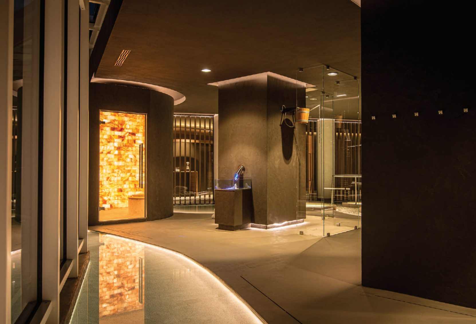
this page_top, 원통형 모양의 Salt Cabin은 발트해 방식에 따라 바닥, 벽, 천장 및 좌석이 완전히 소금으로 덮여 있으며, 분홍색 소금 타일의 백라이트 벽이 특징이다. this page_bottom, Neró Spa 외관 전경 모습.