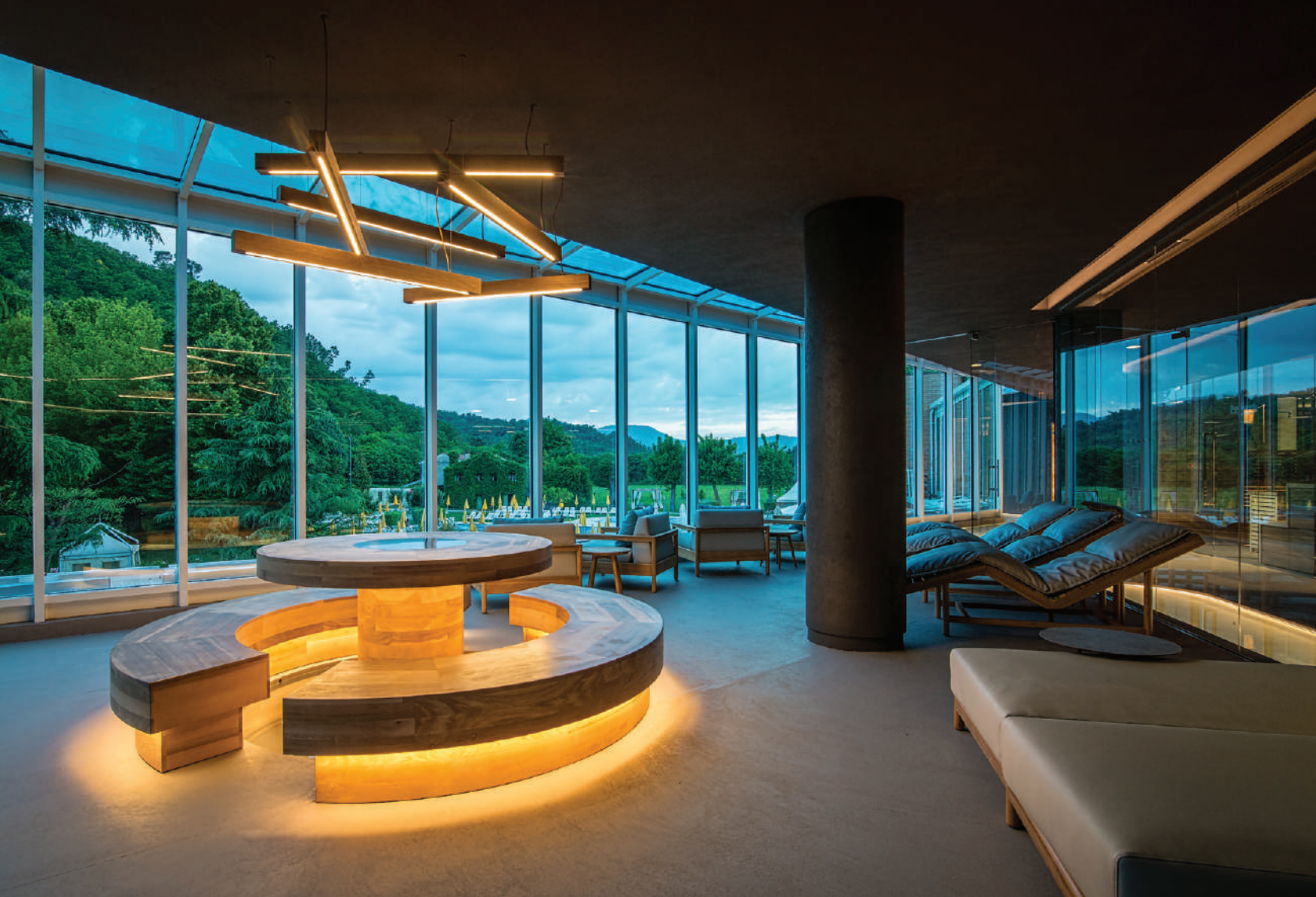
this page. 내부 홀은 허브 및 티를 즐길 수 있도록 제작된 코다츠(Kotatsu, 원형 벤치와 중앙 테이블) 가구가 돋보인다.

이번 프로젝트는 주변 자연과의 직접적인 연결을 통해 깊은 휴식과 조화를 경험하게 했다. Studio Apostoli가 디자인한 새로운 경험의 Neró Spa는 이탈리아 몬테그로토 테르메의 유명한 Hotel Terme Preistoriche에서 수백 년 된 내부 공원이 내려다보이는 건물 최상층에 만들어졌다. 1,200 sqm의 새로운 환경은 총 500㎡가 넘는 수로에서 56개의 월풀과 6개의 경주 폭포를 갖춘 2개의 야외 온천 수영장, 2개의 실내 수영장으로 구성되었다. 아방가르드한 Neró Spa는 예술 작품으로 고안된 다기능적이고 전체론적인 본질을 추구하고 있다. 더욱이 수천 년 동안 물의 치료적 특성 및 가치를 인정해 온 지역의 역사와 영토의 성격을 표현했다. 그만큼 이번 프로젝트는 스파, 영토 및 예술의 조화로운 결합이라고 볼 수 있다. 건축적 관점에서 볼 때 우리의 주된 사용은 고객들에게 풍경에 완전히 몰입되도록 하기 위한 장치인 반면, 디자인 요소로 표현된 목재 및 천연 소재는 환경과의 지속적인 대화를 의미한다. 그만큼 “neró”는 전반적인 웰빙 접근 방식에 대한 주요 역할을 하며, 고대 그리스어로 영양과 수분을 공급하는 식수로 해석된다. 모든 장치는 물에 잠긴 LED 조명 시스템에 의해 그 주변의 윤곽이 잡힌 궤적형 물통에서 나온다. 스파 입구에 있는 물의 수직 벽은 오목한 욕조에 물을 채우기 위해 만들어졌다. 핀란드식 사우나는 전체적으로 유약을 칠하고 삼나무로 만든 벤치를 설치해 은은한 향기가 풍긴다. 티