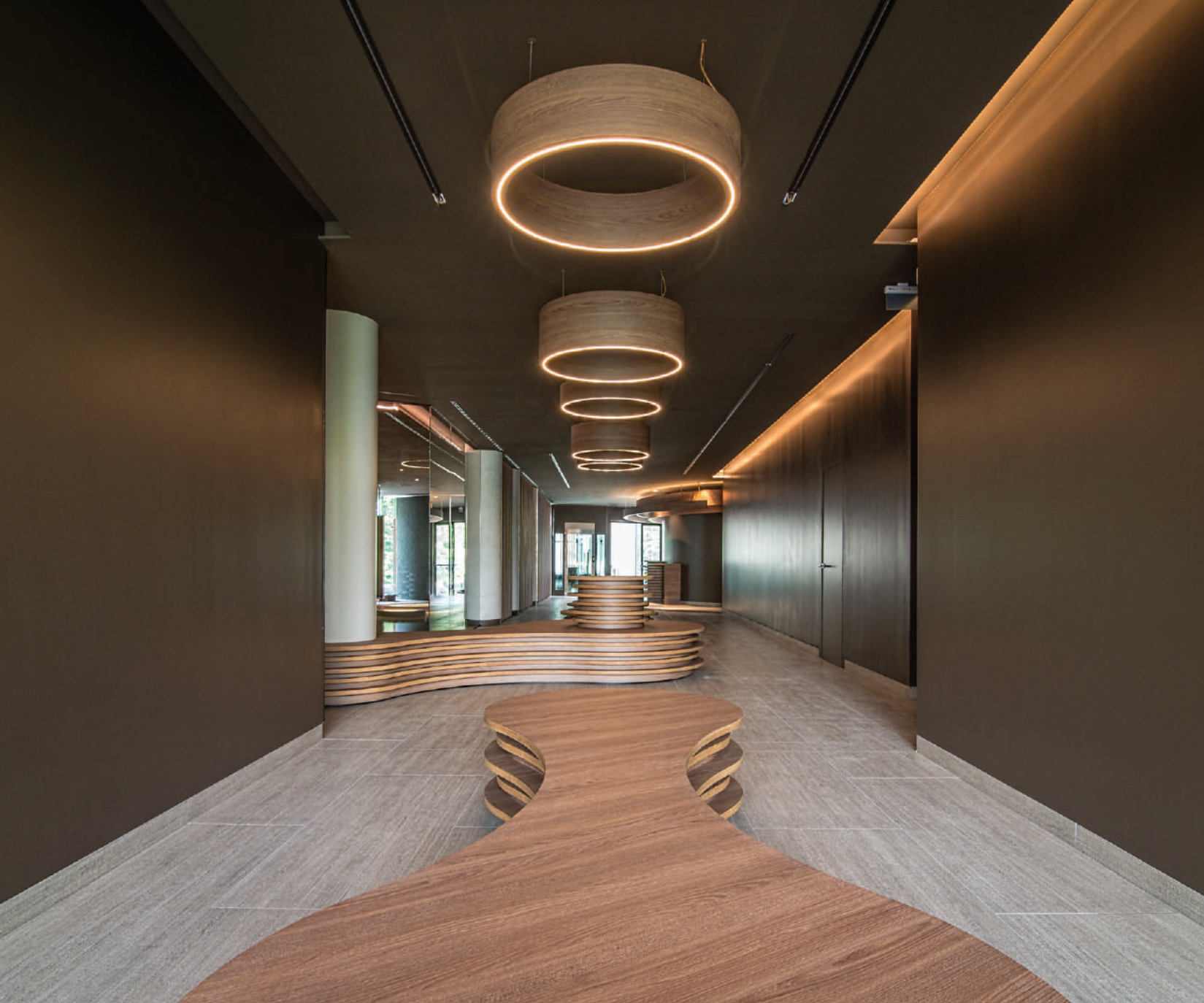
previous page. 아방가르드한 느낌의 Neró Spa 모습. 물에 잠긴 LED 조명 시스템은 물의 시각적인 감성을 풍요롭게 끌어냈다. this & right page. 물의 가치와 특성을 그대로 포용한 내부 공간 모습. 공간은 물의 유연한 흐름처럼 전체 부드러운 곡선으로 디자인됐다.